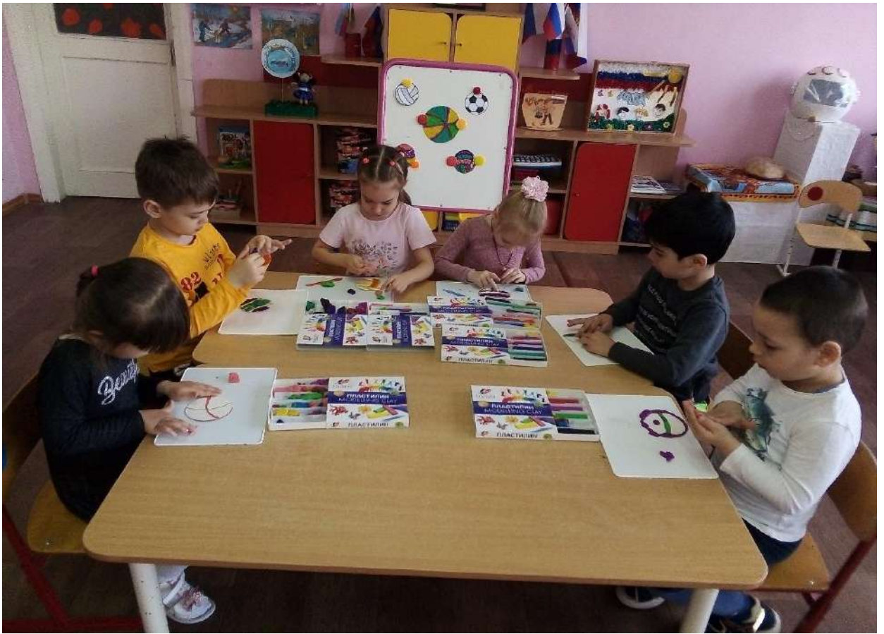
Лепка «Мой веселый звонкий мяч»