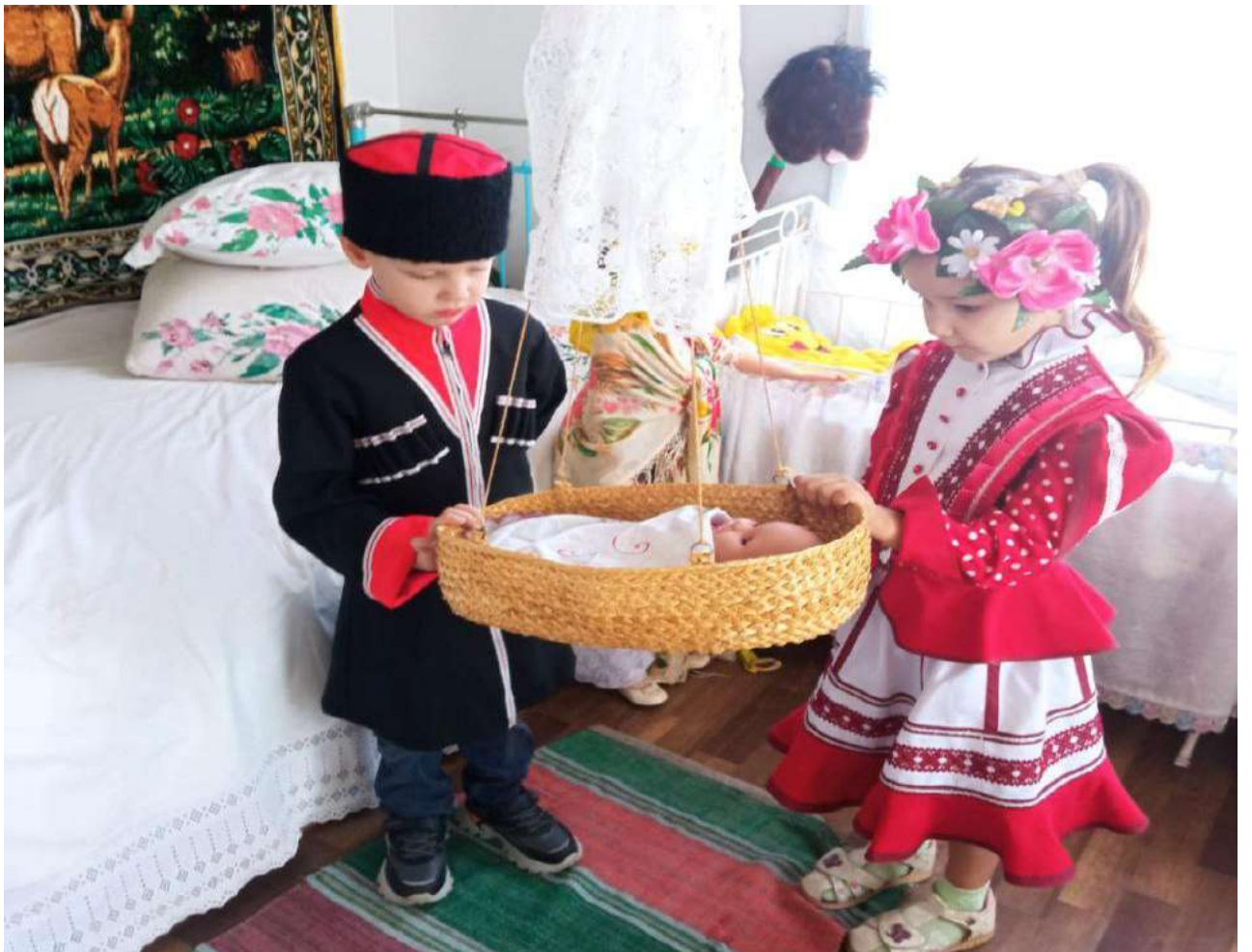
Сюжетно-ролевая игра «Казачья семья»