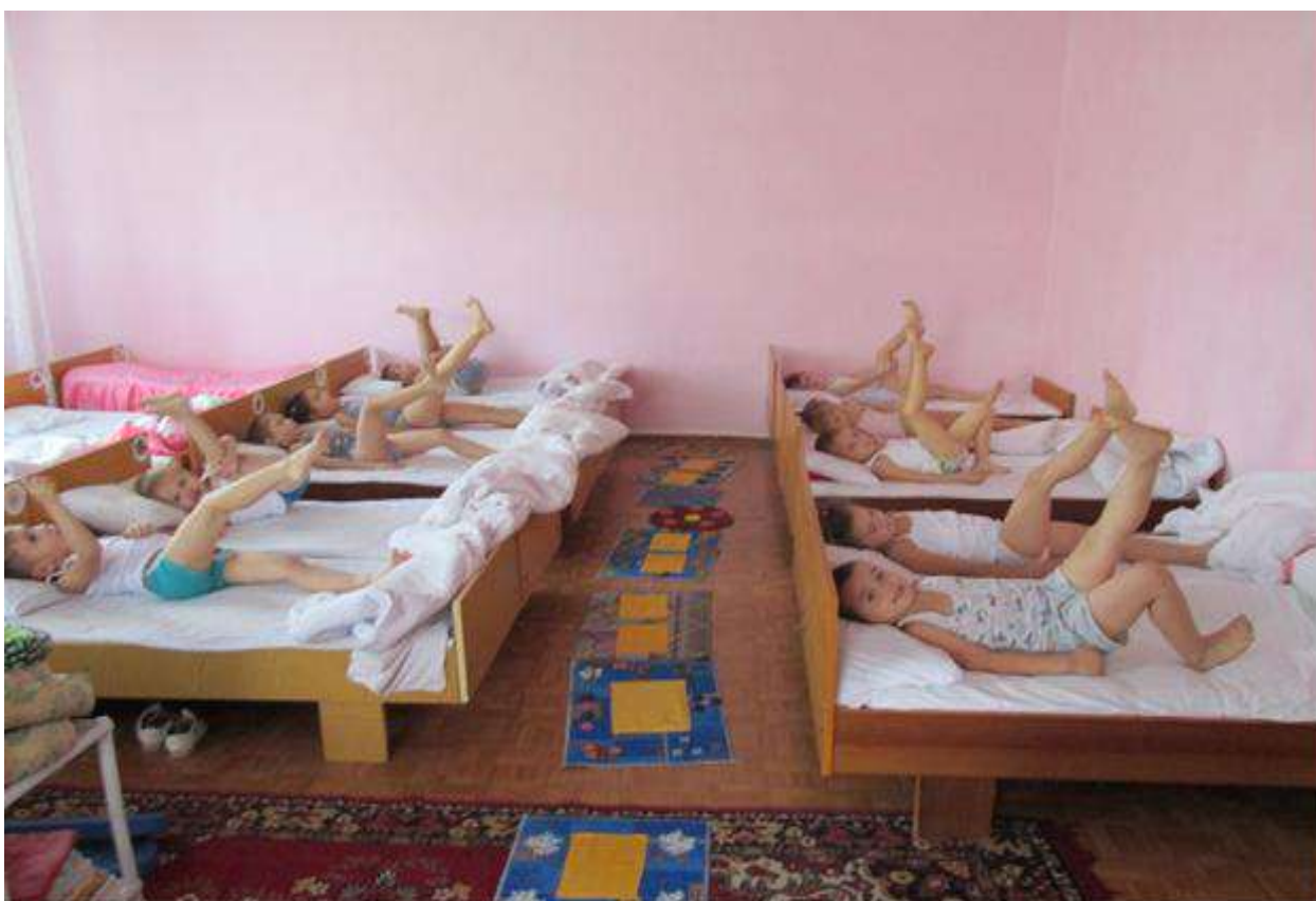
Гимнастика после сна