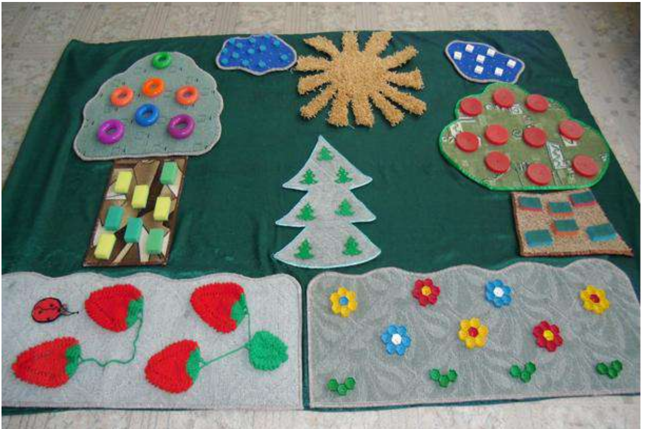
Дорожка здоровья в группе