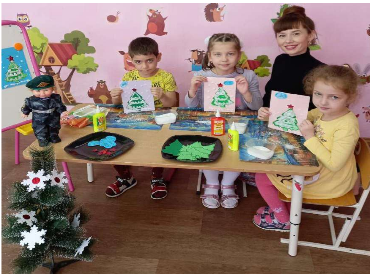
Детское творчество «Новогодняя открытка солдату»