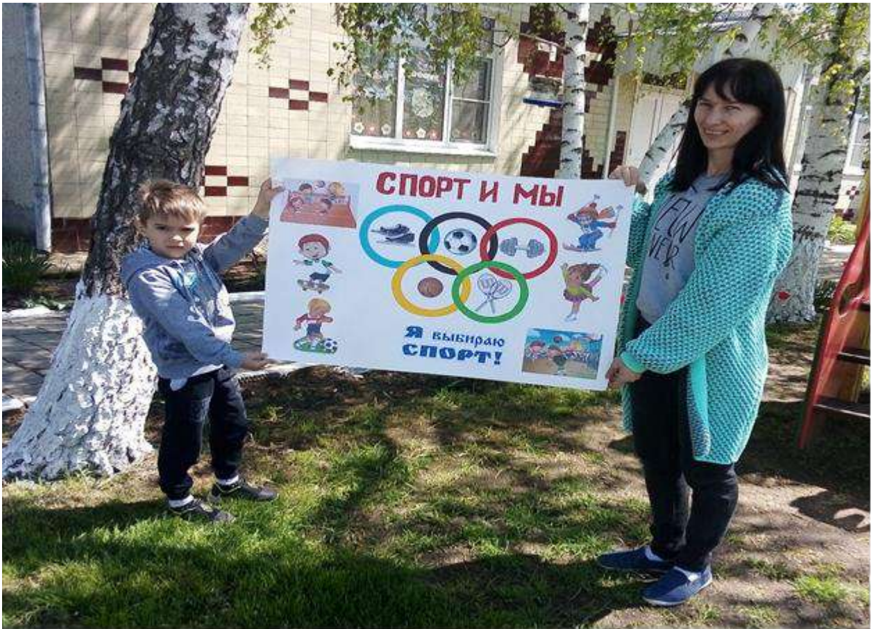
Плакат «Спорт и мы», изготовленный воспитанниками и их родителями.