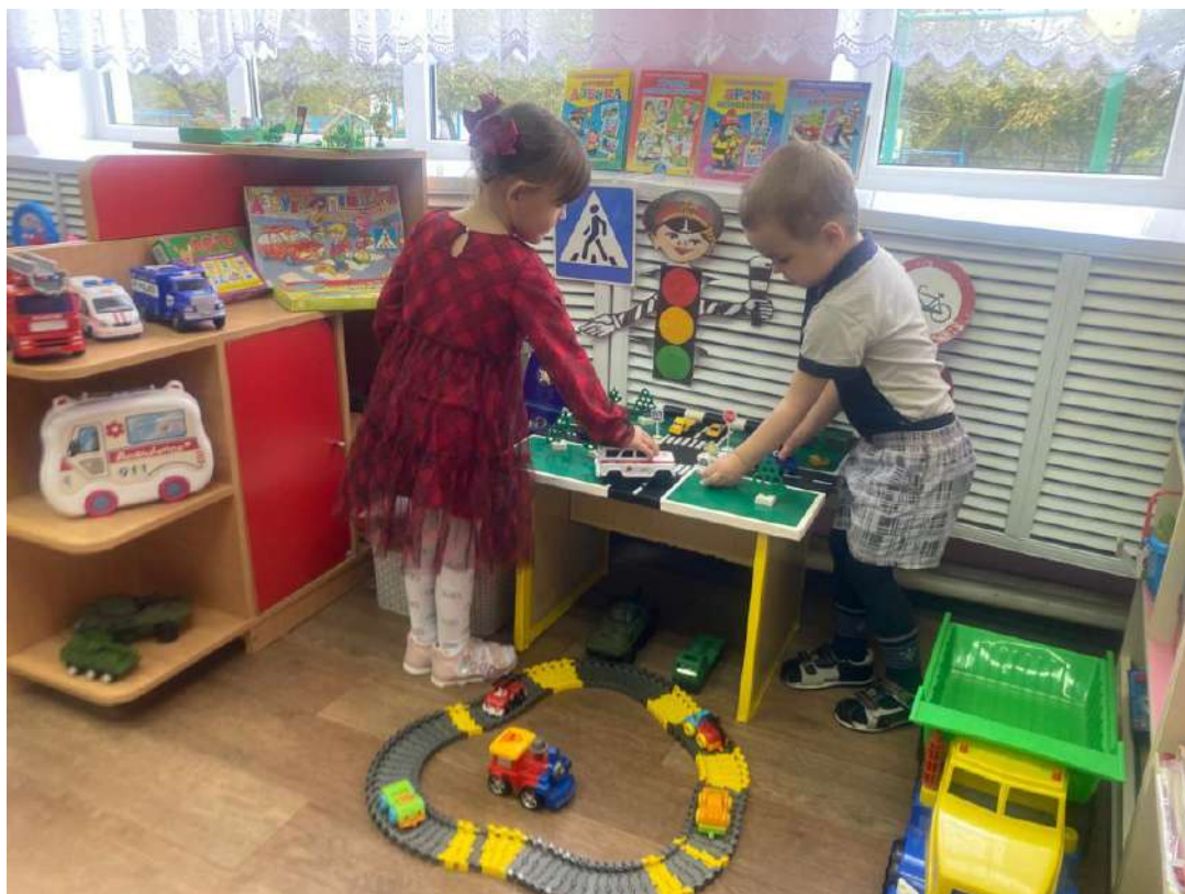
Уголок для родителей по ПДД в группе