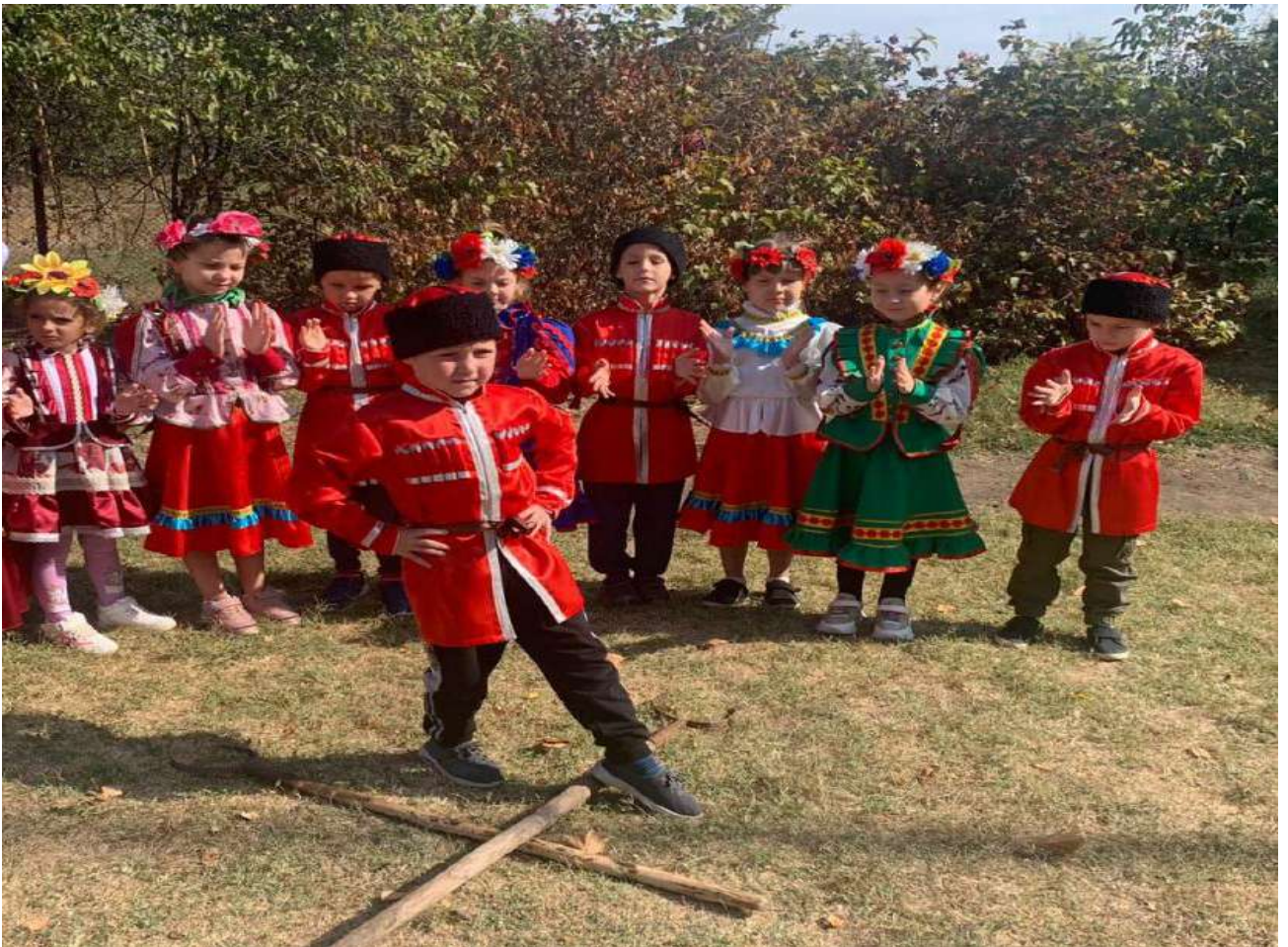
Кубанские игры и забавы