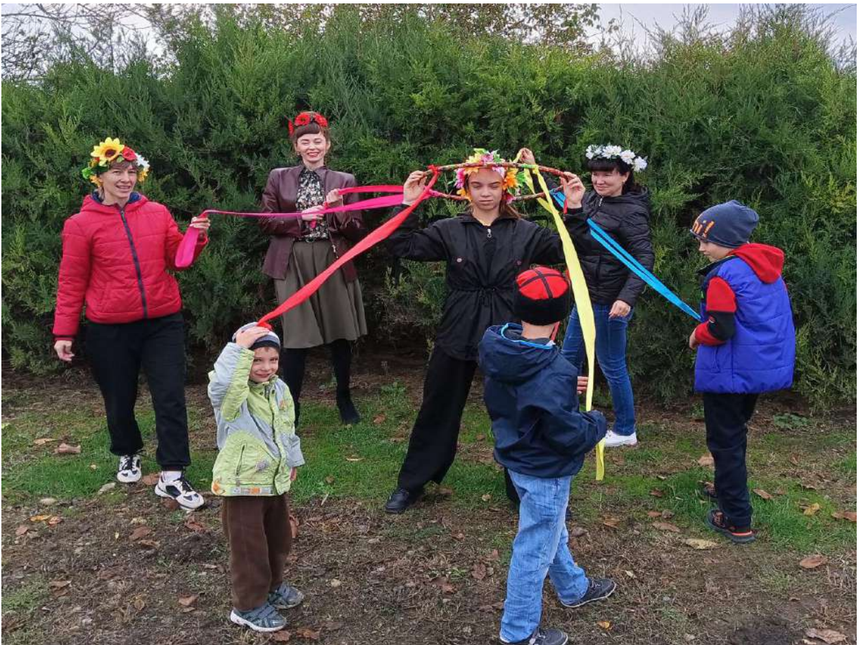
Визит в многодетную семью Ж.