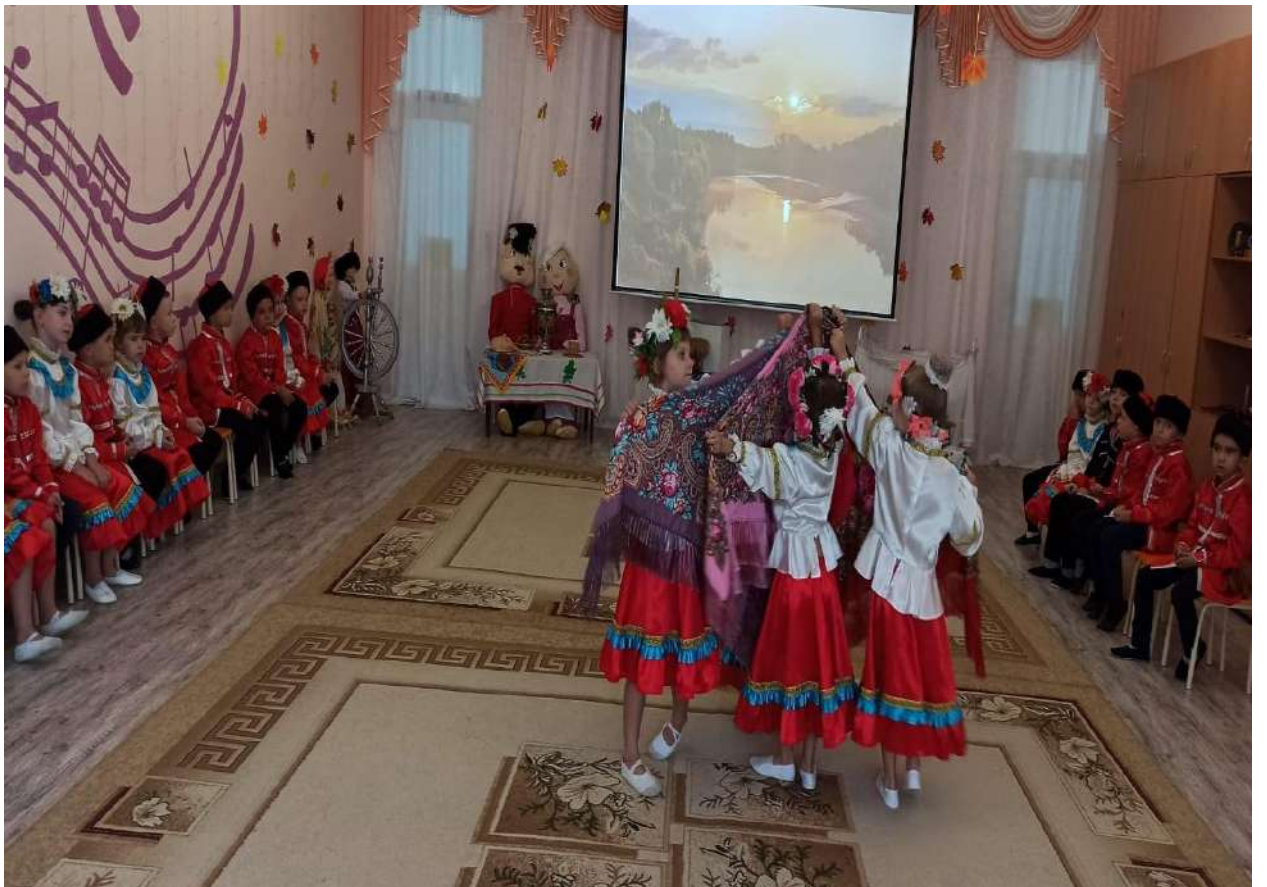
Досуг «Ярмарка народных игр»