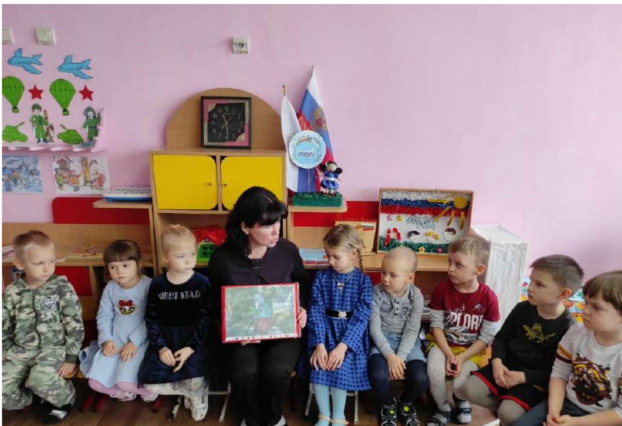
Беседа: «Кто такие защитники Отечества»