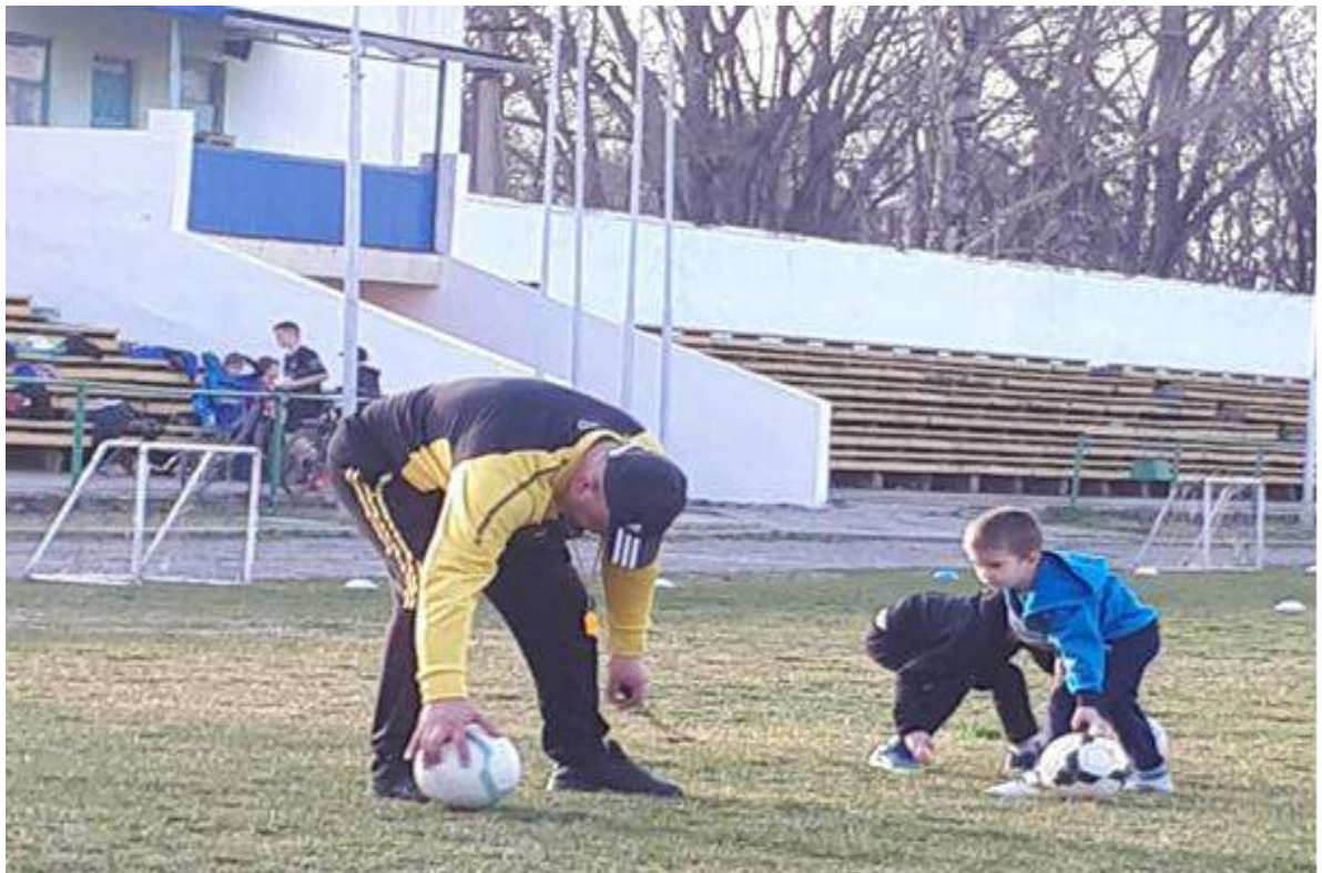
Тренировка. Секция футбол.