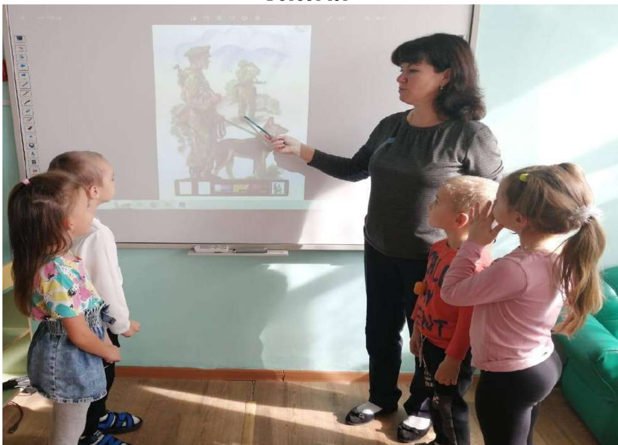
Беседа на тему : «Войска российской армии»