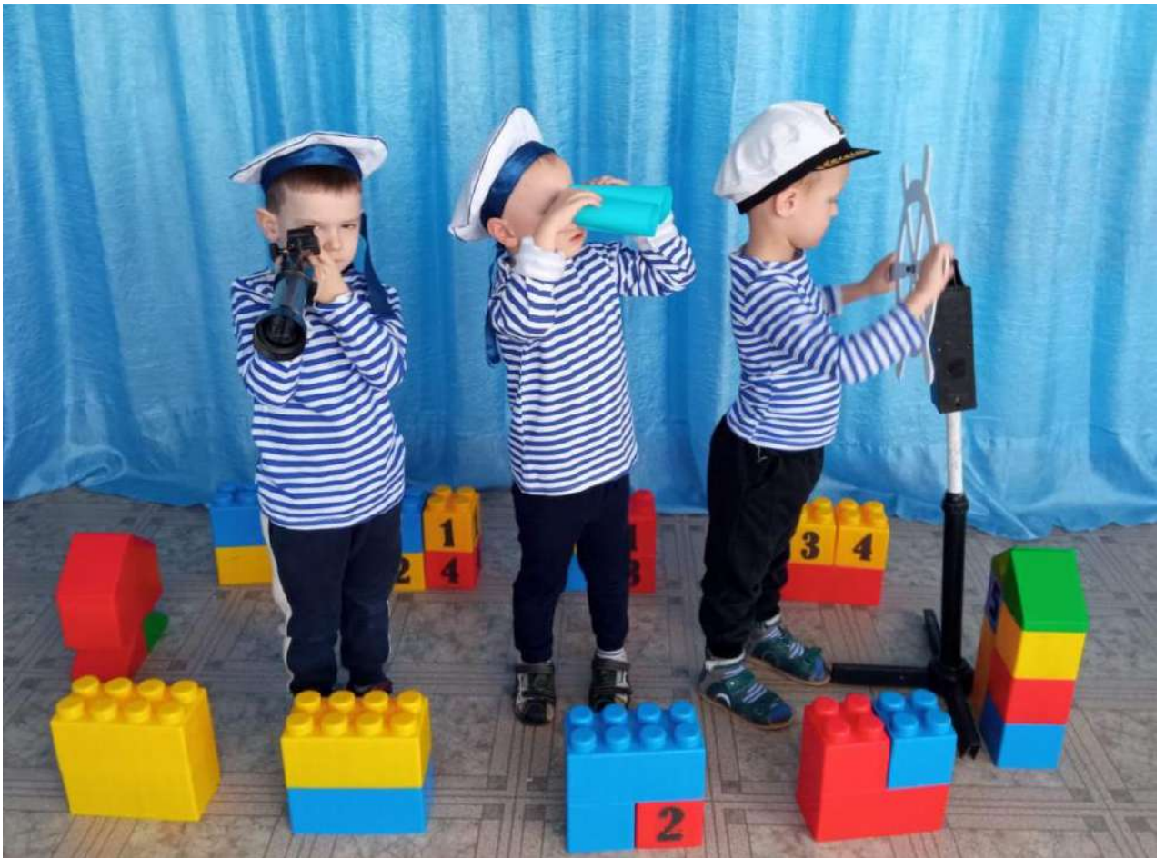
Сюжетно – ролевая игра «Моряки»