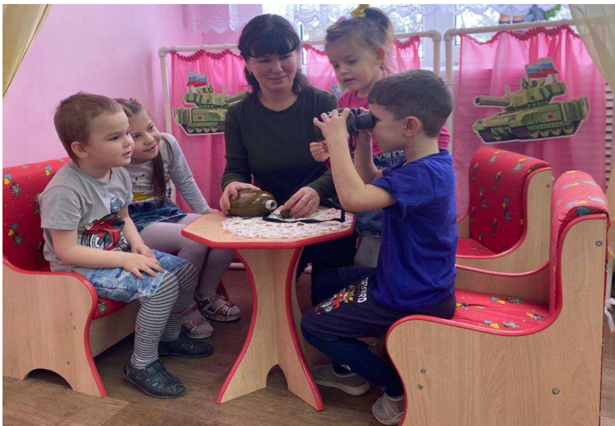
Рассматривание солдатских принадлежностей