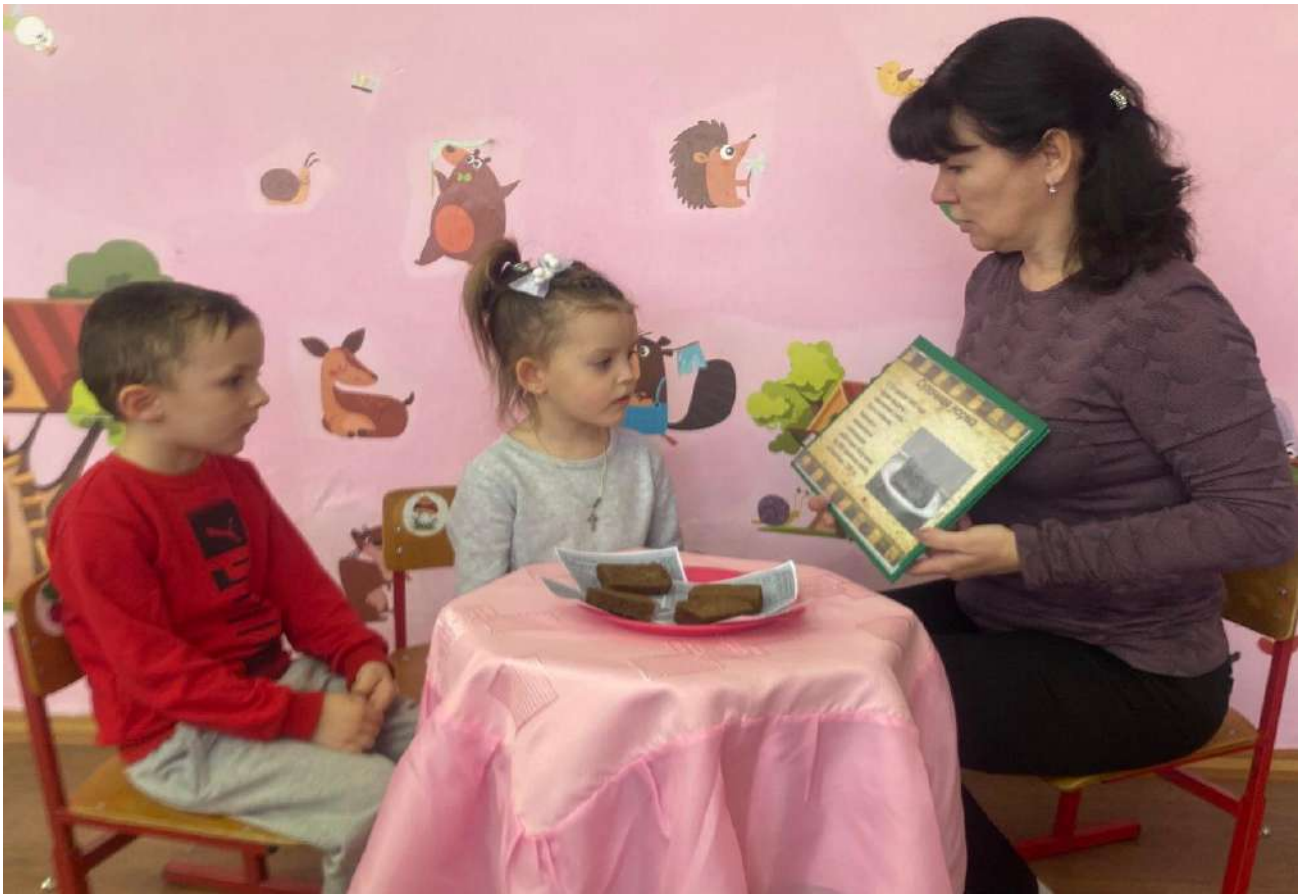
Беседа: «Блокаде Ленинграда»