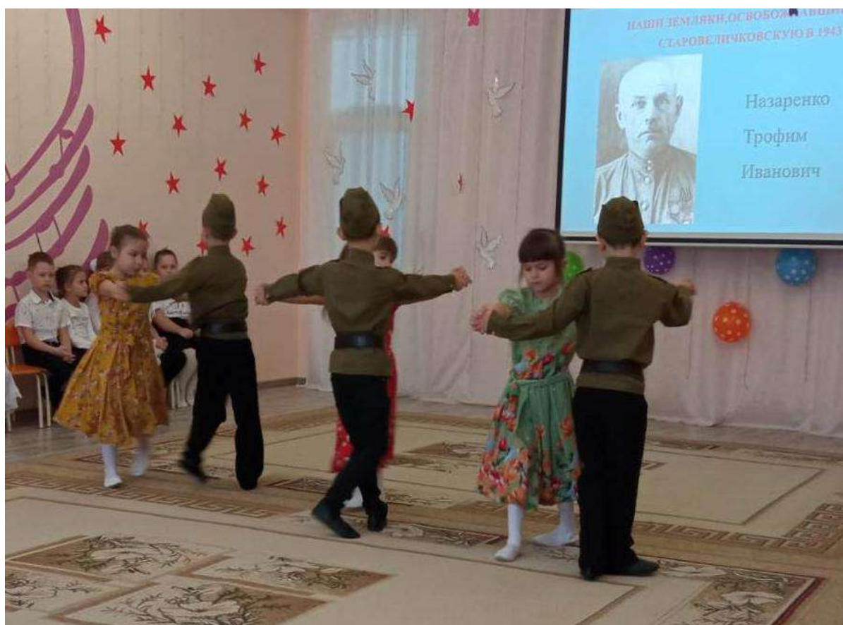
Музыкально – литературная гостиная на тему: «Освобождение станицы Старовеличковской от фашистско-немецких захватчиков»