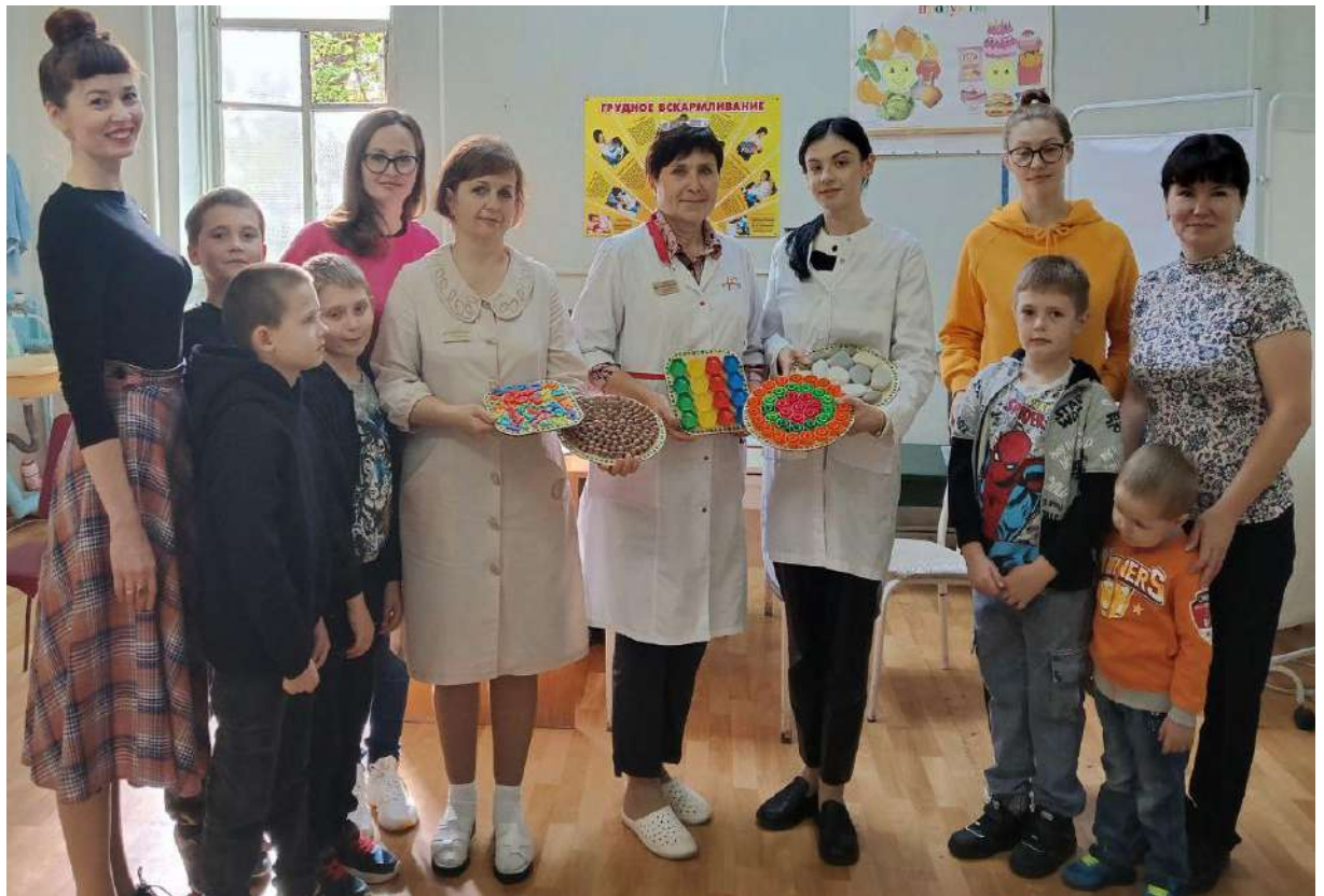
Посещение детской поликлиники с воспитанниками и их родителями