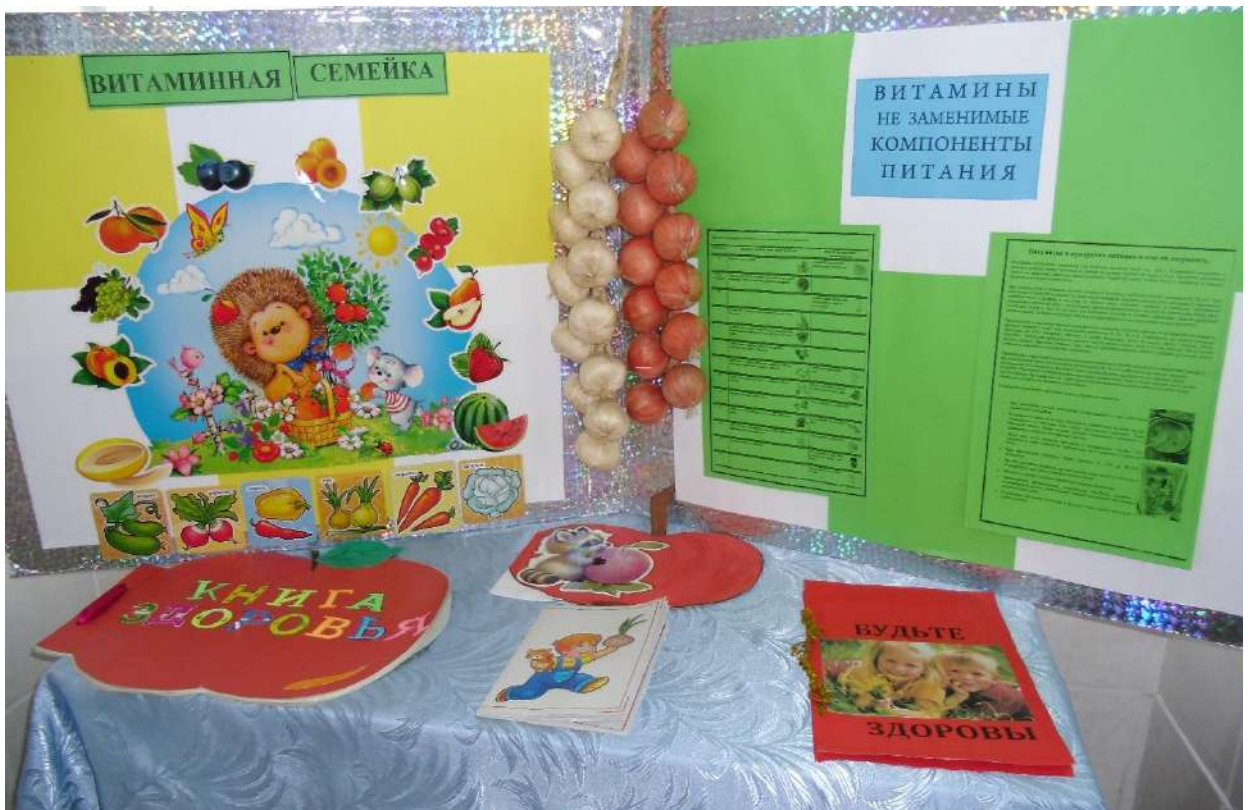
Папка раскладушка «Витамины - наши друзья»