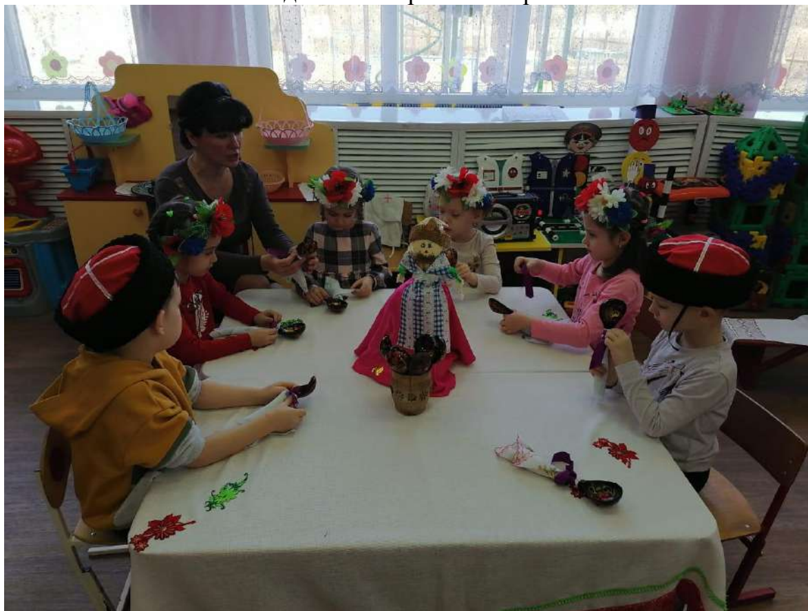
Мастер-класс «Кукла из ложки»