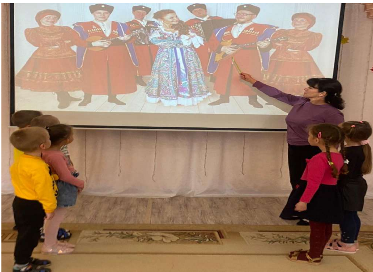
Беседа: «Кубанские казаки»