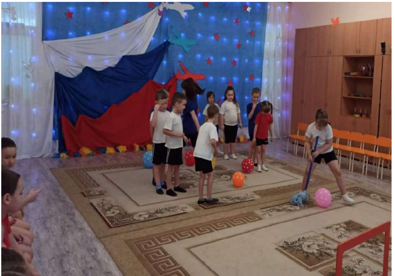
Спортивное развлечение для детей с участием пап воспитанников «Мы будущие защитники»