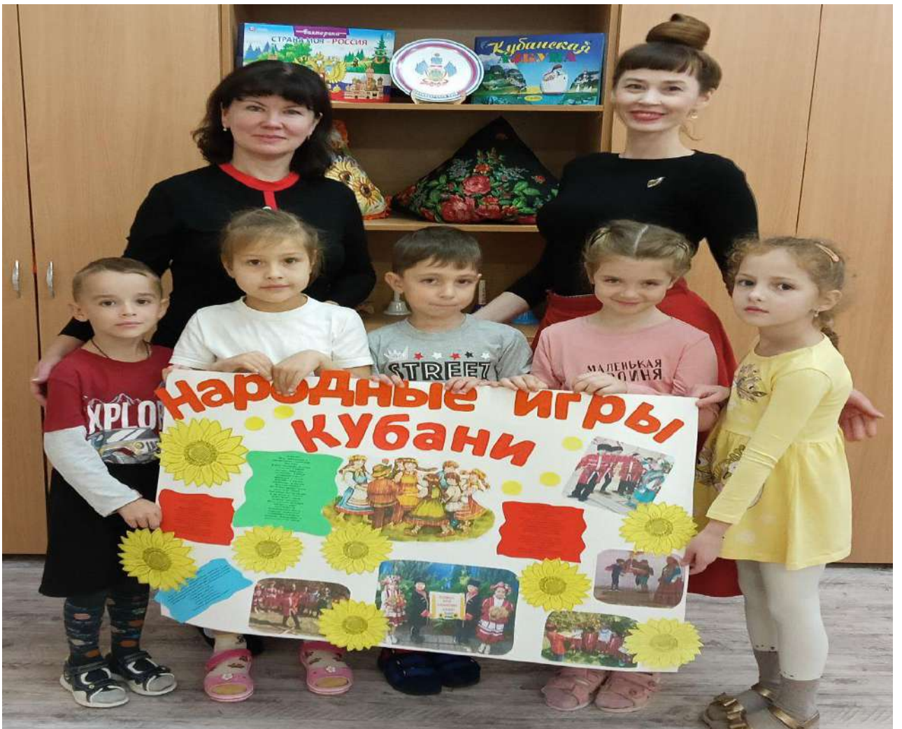
Коллективное творчество воспитанников и воспитателей (изготовление стенгазеты)