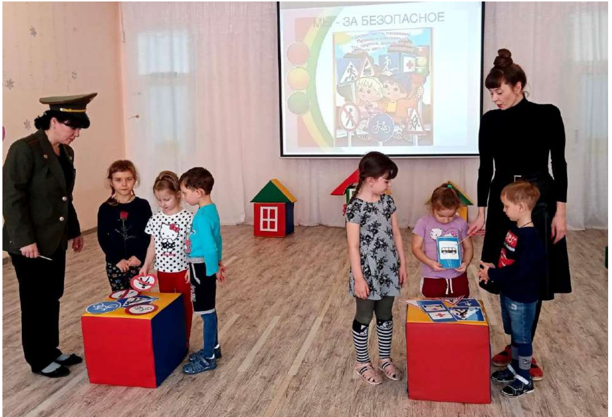
Мероприятия с детьми « В гостях у инспектора Знайкина»