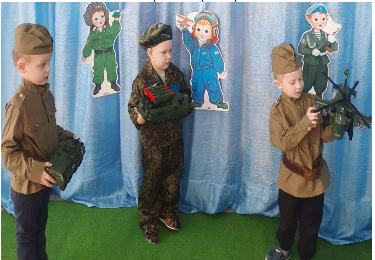
Сюжетно – ролевая игра «Военные»