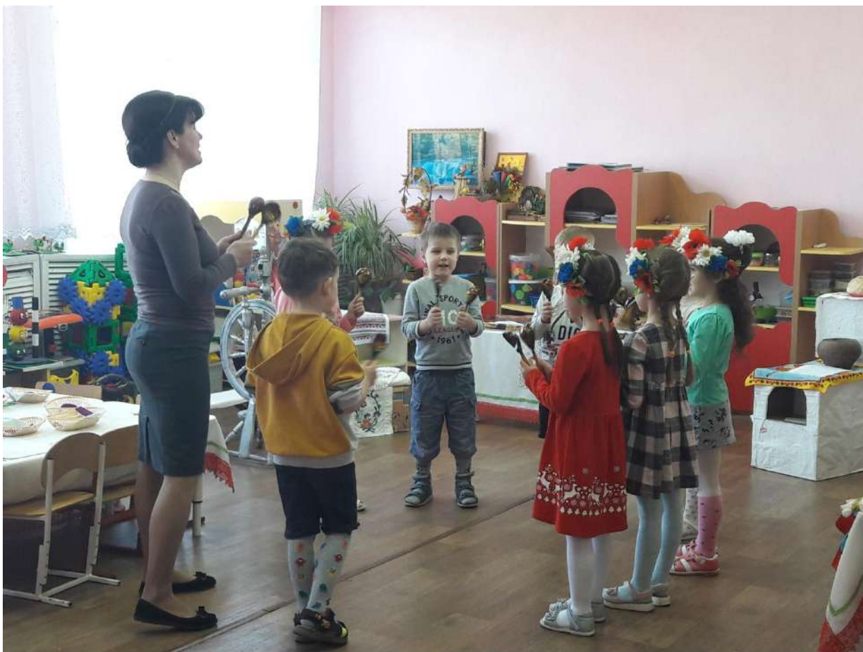
Подвижная игра «Ложкари»