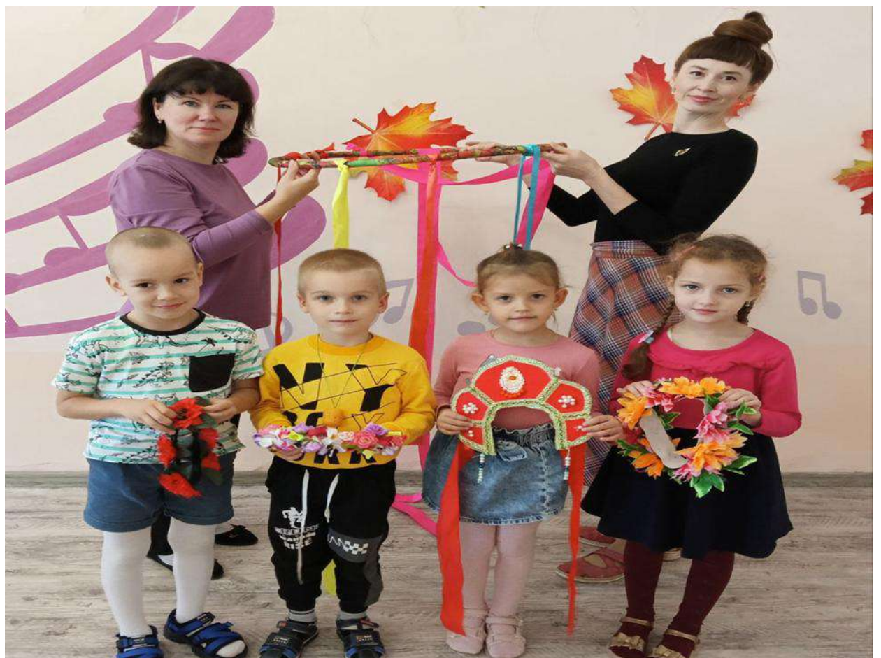
Совместное творчество детей с родителями и воспитателями группы по изготовлению атрибутов для подвижных народных игр.