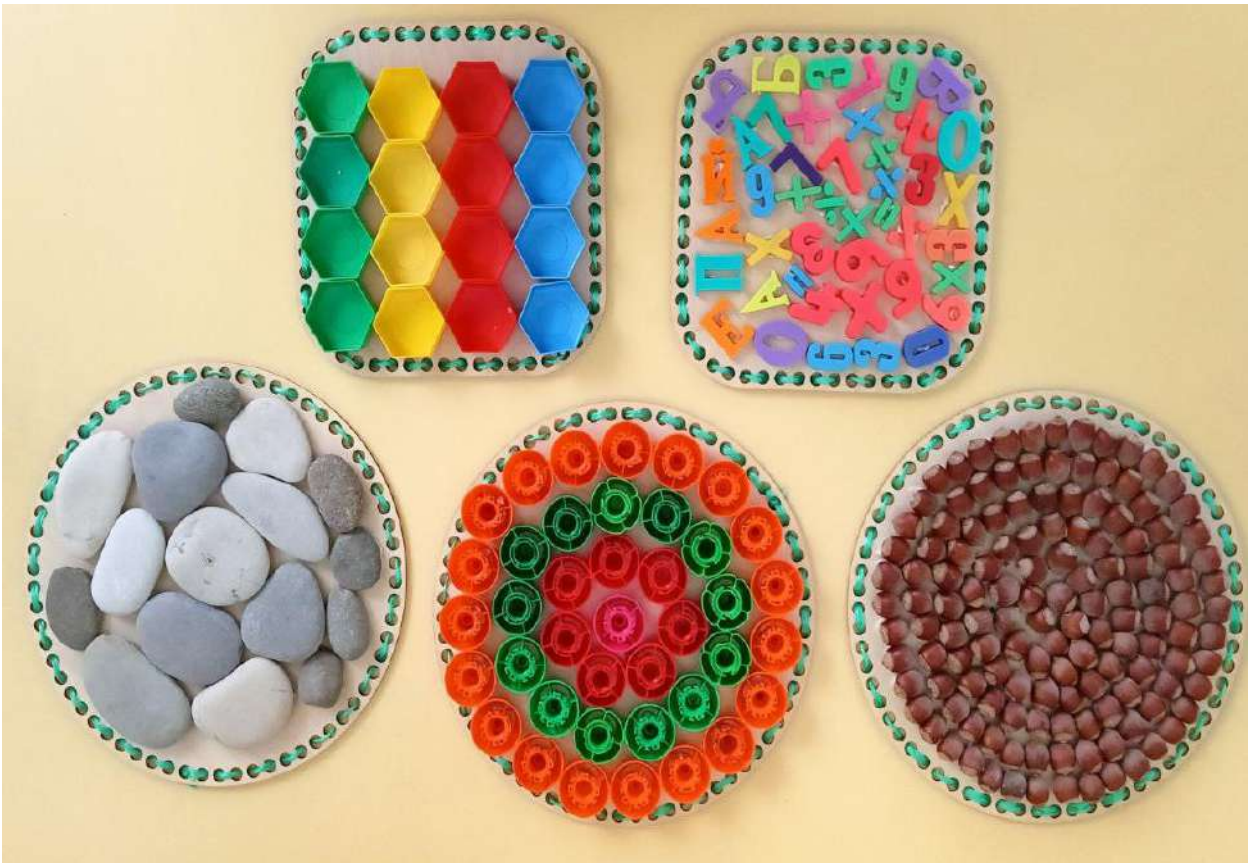
Массажеры, сделанные своими руками

Как управлять устройством С помощью своего аппарата, А также с помощью Остаточных усилий.