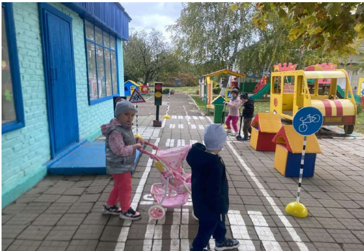
Уголок ПДД по работе с детьми в павильоне