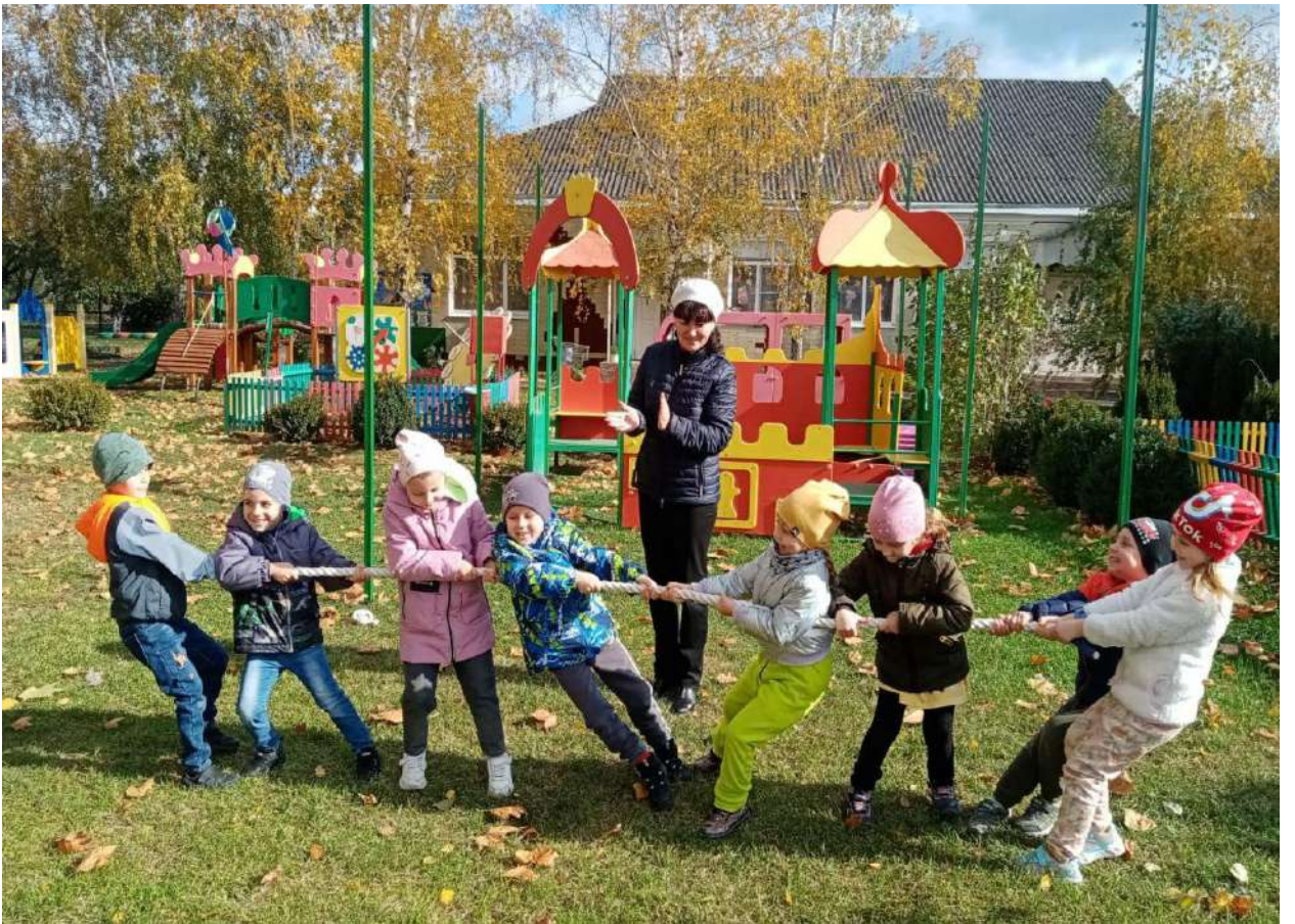
Народные игры на воздухе