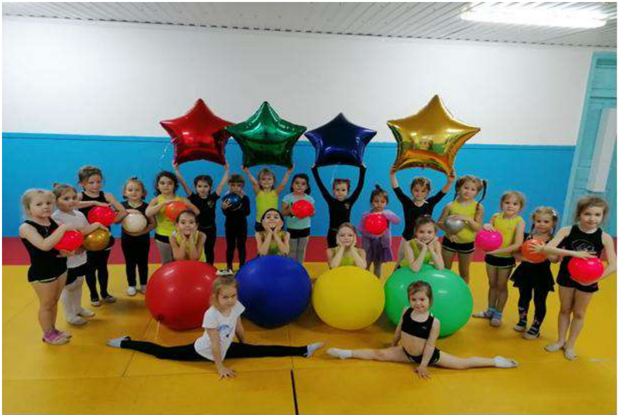
Секция «Художественной гимнастики»