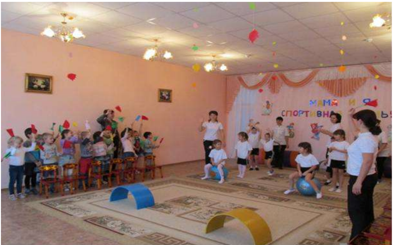
Спортивный праздник с родителями «Мама и я - спортивная семья»