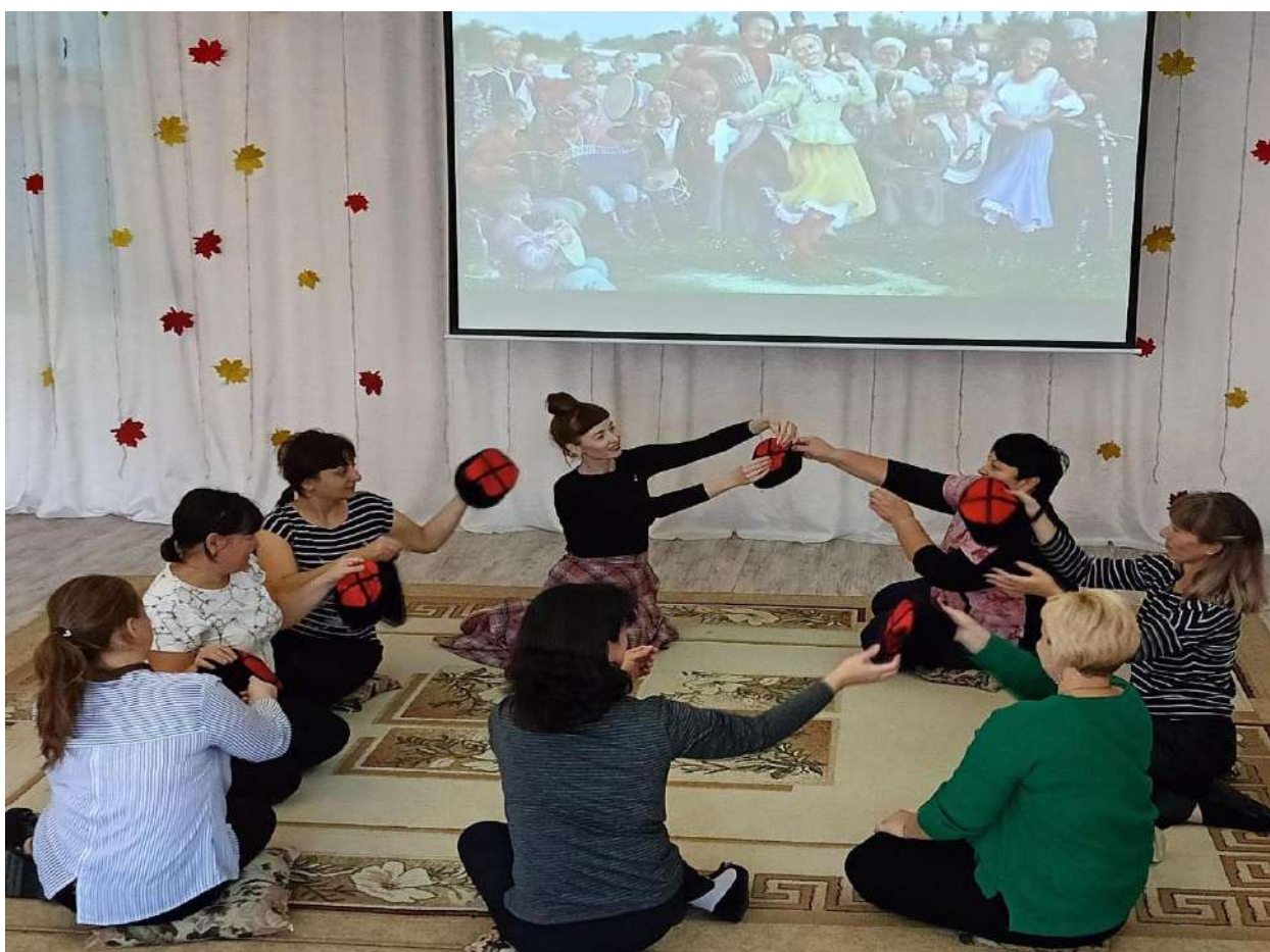
Мастер-класс с родителями чьи дети не посещают детский сад «Русские народные игры и хороводы как средства приобщения к русским традициям в семье»