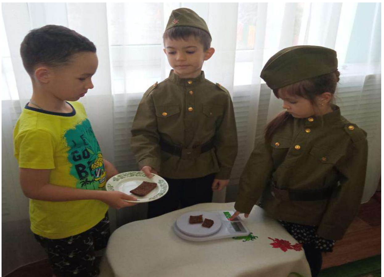
Акция «Блокадный хлеб»