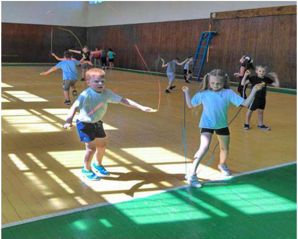
Тренировка. Секция волейбол.