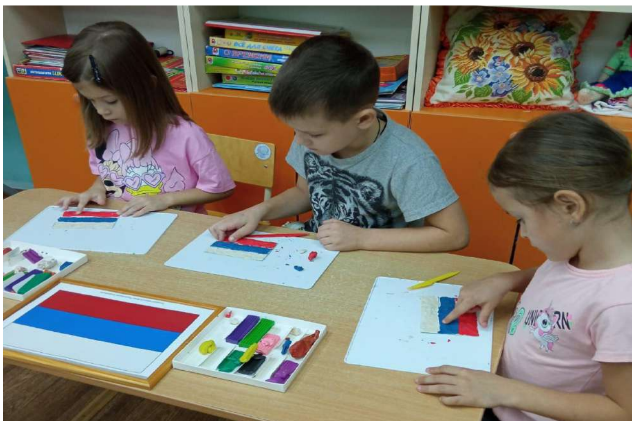
Детское творчество «Символы моей страны»