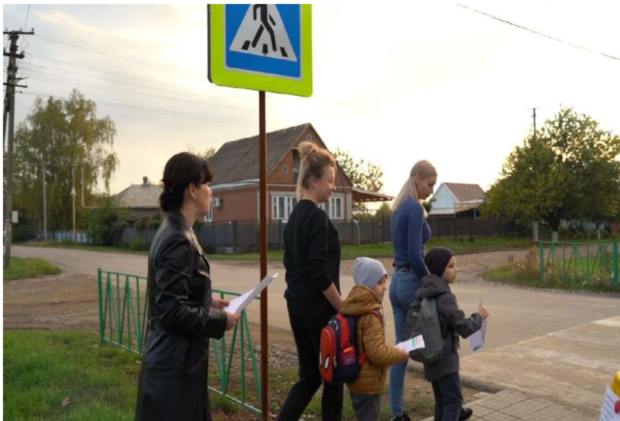
Акция «Автобусная остановка»