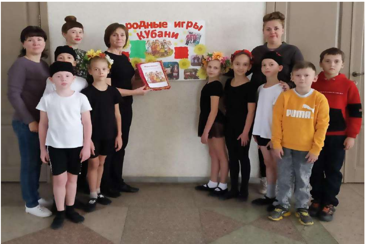
Совместное посещение воспитателями, воспитанниками и их родителями дома культуры ст. Старовеличковской.