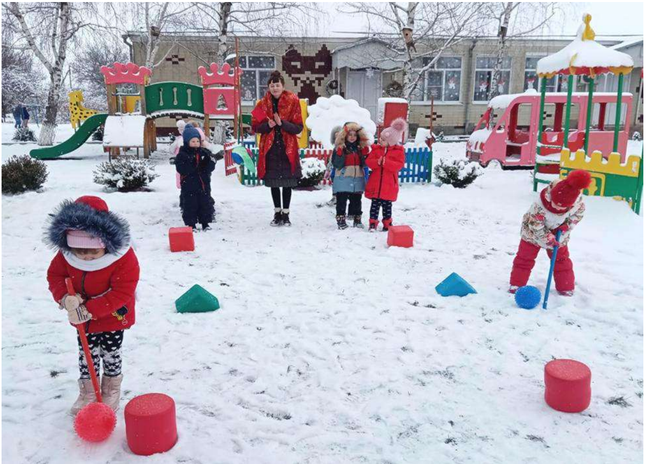
Игры на свежем воздухе