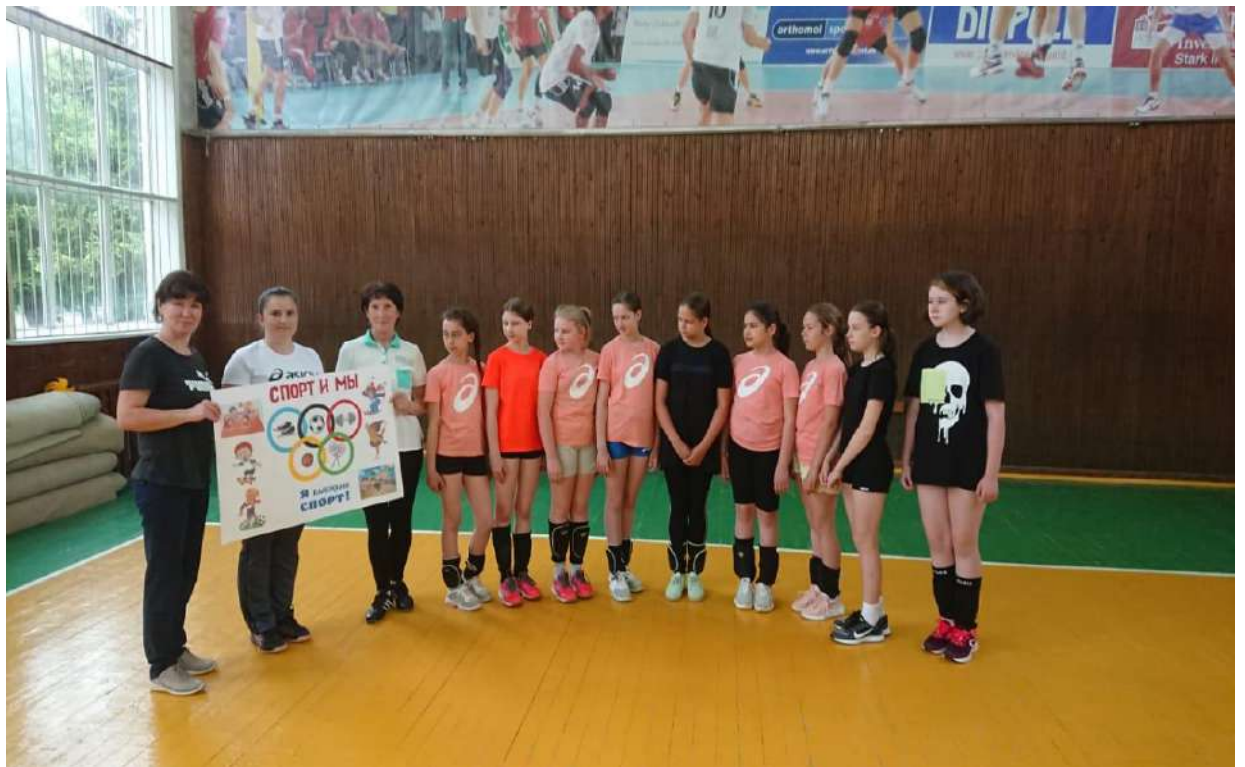
Посещение спортивной школы