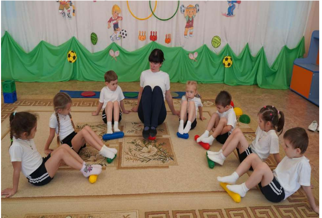
Массаж стоп с помощью оборудования