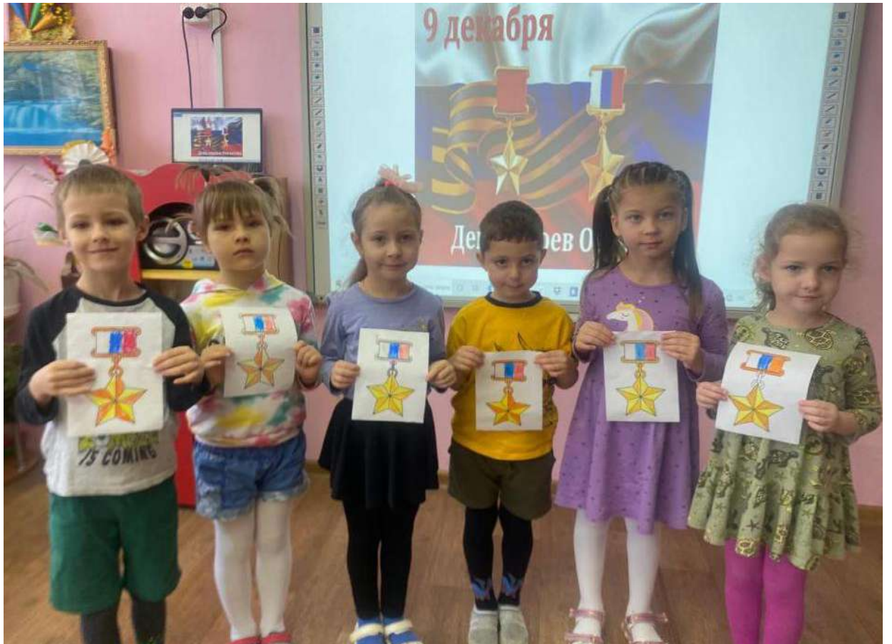
Детское ворчество «День героев Отечества»