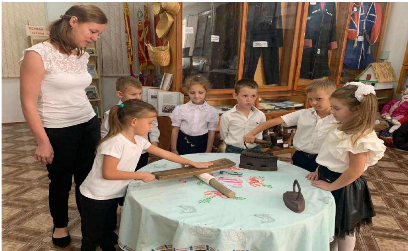
Посещение Народного музея ст. Старовеличковской